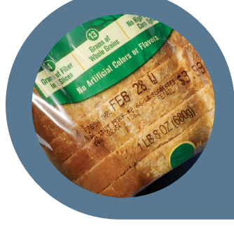
Backwaren und Cerealien