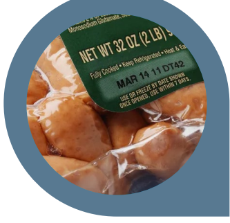
Fleisch und Geflügel